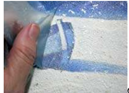
6 Sviluppo tecnica e realizzazione Lara Vella