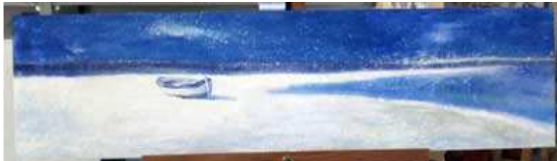
Trasferimento di pigmento da poster 130 x 35 cm Riproducente una Spiaggia

Esempi fotografici dei passaggi fondamentali