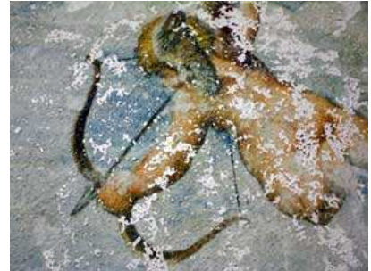
Sviluppo tecnica e realizzazione Lara Vella

Per la preparazione della base applicare uno strato di Fondo Universale ed attendere l'asciugatura. Aiutandosi con una spatola stendere sulla base di compensato o su di una tela l'intonaco per creare un fondo materico non uniforme ed attendere l'asciugatura